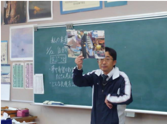
扱う題材の内容を知らせる