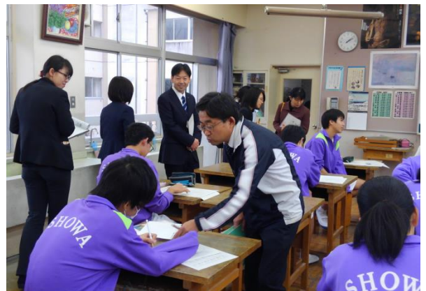
自分の未来のアイディアスケッチを練る