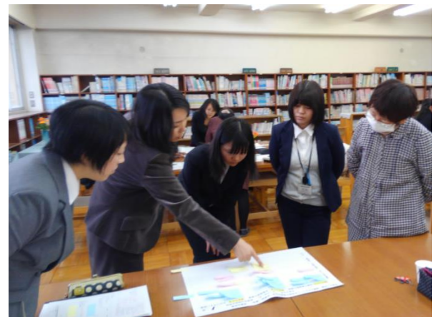
グループ単位での研究協議