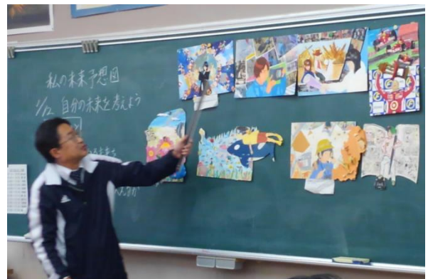
参考作品の提示によるねらい・材料の説明