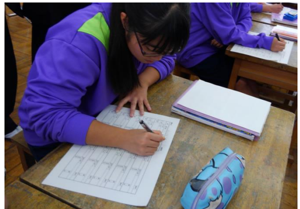
「進度表」に本時の学習内容を記入する