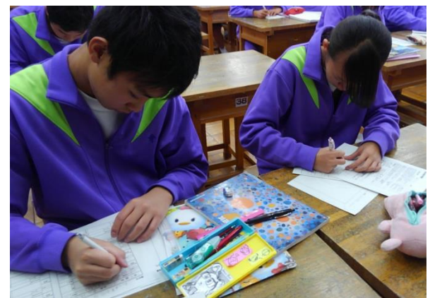
評価用紙で本時の学習活動を振り返る