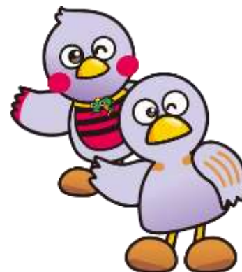
埼玉県マスコット コバトン&さいたまっち