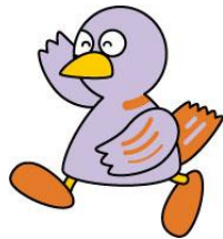
埼玉県マスコット「コバトン」