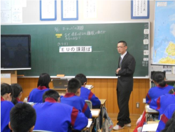
【本時の目標を知り、学習の見通しをもつ】