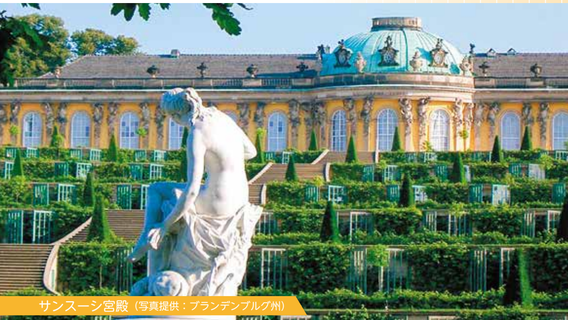
サンズーシ宮殿

首都ベルリンを取り囲むように位置し、森と湖に恵まれた自然の豊かな州。壮大な庭園を持つフリードリヒ2世の離宮、サンズーシ宮殿は世界遺産に登録されている。州都ポツダムは、昭和20年8月、日本に対して第二次世界大戦の終結を求めた「ポツダム宣言」が発せられた地として有名。