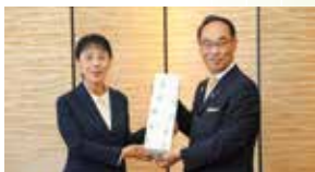
山西省副省長と知事の会談（6年度）