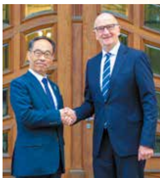
ブランデンブルグ州首相と知事の会談 （7年度）

首都ベルリンを取り囲むように位置し、森と湖に恵まれた自然の豊かな州。壮大な庭園を持つフリードリヒ2世の離宮、サンズーシ宮殿は世界遺産に登録されている。州都ポツダムは、昭和20年8月、日本に対して第二次世界大戦の終結を求めた「ポツダム宣言」が発せられた地として有名。