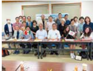
メキシコ州政府職員とこうのす国際交流市民の会との交流（4年度）

メキシコ合衆国の中央部に位置。大部分が標高2,000mを超える高地で首都メキシコシティを三方から取り囲んでいる。トモロコシ栽培などの農業が盛んでサラベというカラフルな織物が有名。紀元前に繁栄したテオティワカン文明の「太陽の神殿」「月の神殿」やスペイン統治時代に建てられた荘厳なバロック建築の教会テポツォトランなど、遺跡・名所が多い。