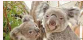
姉妹提携30周年を記念して寄贈されたコアラ（平成26年度）