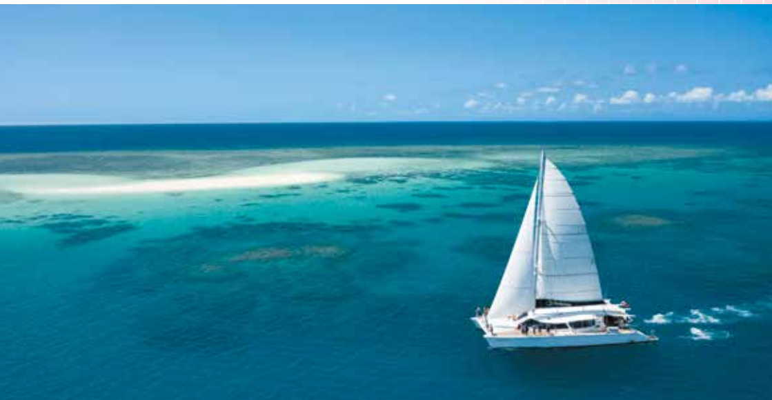
グレートバリアリーフ

オーストラリアの北東部に位置し、世界最大のサンゴ礁グレートバリアリーフやケアンズ、ゴールドコーストなどのリゾート地は世界的に有名。砂糖や肉牛の生産が盛ん。東松山市のこども動物自然公園には、友好のシンボルとして同州からコアラとカンガルーが贈られた。