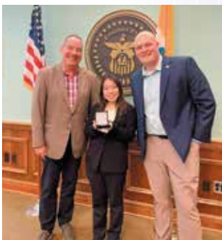
ジョブシャドウイングに参加する県派遣奨学生（7年度）

北部は五大湖のエリー湖に接する。全米有数の工業州で、ホンダをはじめ多くの日系企業が進出。全米有数の穀倉地帯でもある。100以上の大学・短期大学があり、そのうち14が公立大学である。また、州内には500以上の博物館、美術館等があり、シンシナティ美術館やクリブランド美術館が有名。エジソンやライト兄弟、アームストロング（宇宙飛行士）などが同州の出身。