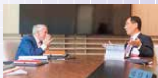
オハイオ州知事と知事の会談（6年度）