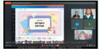
日墨高校生オンライン交流での学生発表（3年度）