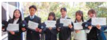
イエップーン高校への県派遣奨学生（7年度）