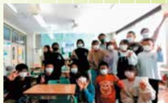
友好提携40周年を記念した オンライン小学生交流（4年度）