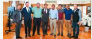
メキシコ州花火訪問団の知事表敬訪問（元年度）