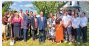
知事のフィンドレー大学への訪問（6年度）