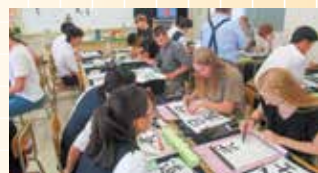
大宮高校とコト布斯第4ギムナジウム校との交流 （6年度）