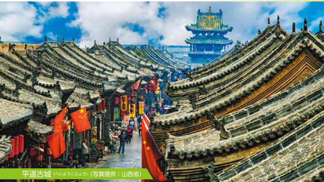
平遥古城（へいようこじょう）

北京の西南方、黄河の中流に位置する内陸省。良質の石炭など鉱物資源に恵まれているほか、世界文化遺産に登録されている中国三大石窟の一つである雲岡石窟や中国四大仏教名山の一つ、五台山など、豊富な歴史・文化遺産でも有名。