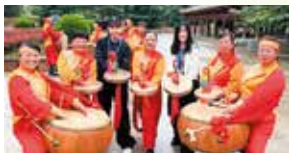
県内大学生の山西省訪問（7年度）

近年はエネルギー問題にも注力し、太陽光などの新エネルギー発電設備の割合は省内の発電設備の40%以上を占めている。