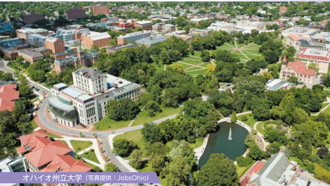
オハイオ州立大学

北部は五大湖のエリー湖に接する。全米有数の工業州で、ホンダをはじめ多くの日系企業が進出。全米有数の穀倉地帯でもある。100以上の大学・短期大学があり、そのうち14が公立大学である。また、州内には500以上の博物館、美術館等があり、シンシナティ美術館やクリブランド美術館が有名。エジソンやライト兄弟、アームストロング（宇宙飛行士）などが同州の出身。