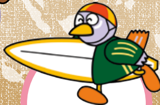
クイーンズランド州 Queensland