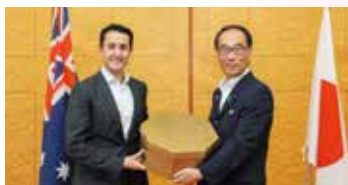
クィーンズランド州首相と知事の会談（7年度）

2032年の夏季オリンピック・パラリンピック競技大会が州都ブリスベンで開催されることが決定している。