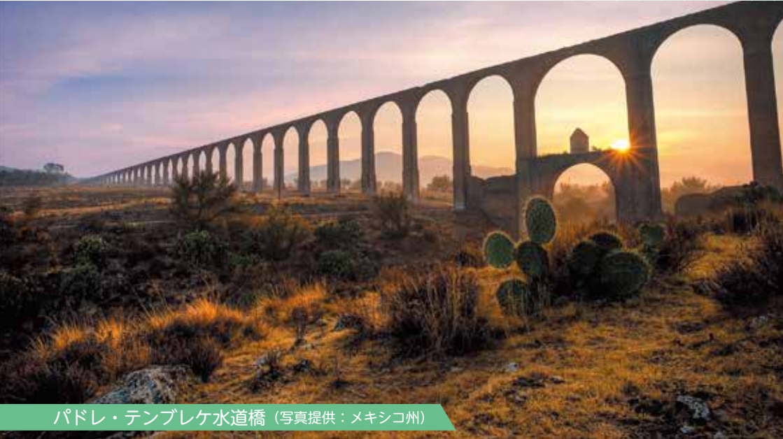
パドレ・テンブレケ水道橋

メキシコ合衆国の中央部に位置。大部分が標高2,000mを超える高地で首都メキシコシティを三方から取り囲んでいる。トモロコシ栽培などの農業が盛んでサラベというカラフルな織物が有名。紀元前に繁栄したテオティワカン文明の「太陽の神殿」「月の神殿」やスペイン統治時代に建てられた荘厳なバロック建築の教会テポツォトランなど、遺跡・名所が多い。