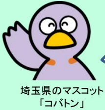
埼玉県のマスコット 「コバトン」