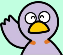
埼玉県のマスコット 「コバトン」