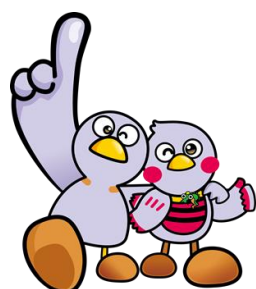
コバトン さいたまっち

さいたまっちは、平成 26 年(2014 年)11 月 14 日(県民の日)に誕生したマスコット。「くりくりおめめ」と「お腹のボーダー」がトレードマーク。コバトンと一緒に埼玉県を全力でPRしています。