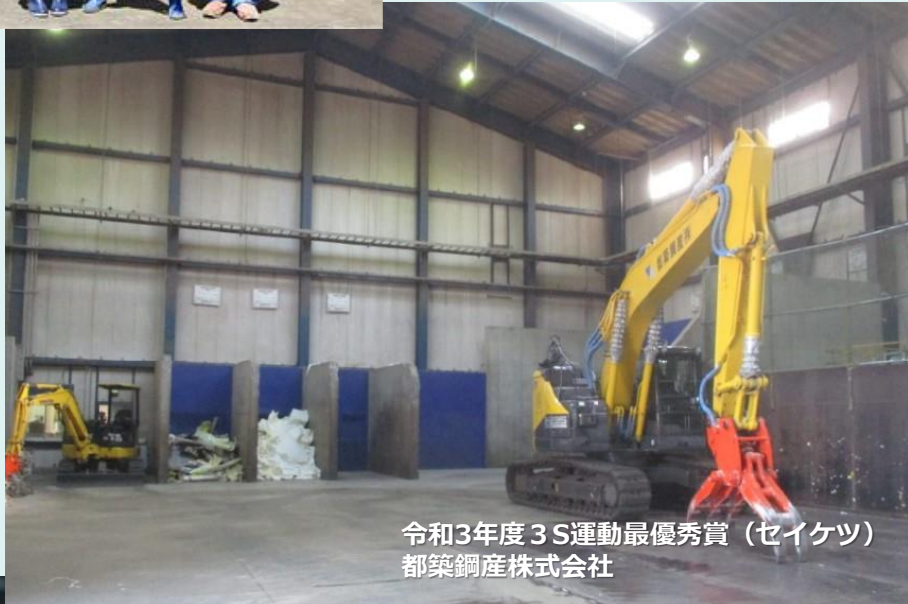
令和3年度3S運動最優秀賞（セイケツ） 都築鋼産株式会社