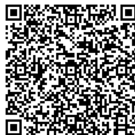
埼玉県HP 「3S運動推進事業者」 登録のすすめ