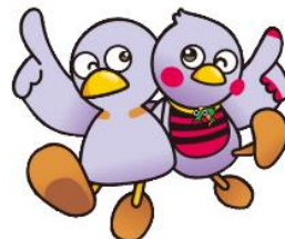
埼玉県マスコット 「コバトン」「さいたまっち」

3S運動を実践している産業廃棄物処理業者の皆様にご登録いただき、それぞれの取組を通じて、3S運動を盛り上げていくものです。簡単に登録できますので、是非、御参加ください。