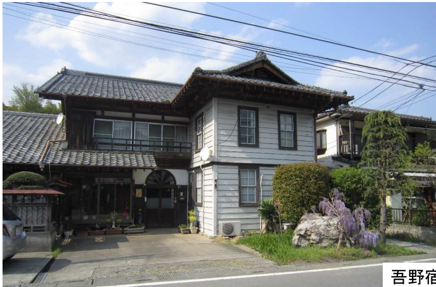
吾野宿・石田家 [藤田屋]