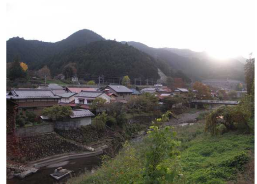
高麗川越しに吾野宿を望む

吾野宿は江戸時代、秩父往還道の馬継ぎ宿として栄えた宿場町であり、民家が並ぶまちなみは今でも当時の面影を残している。