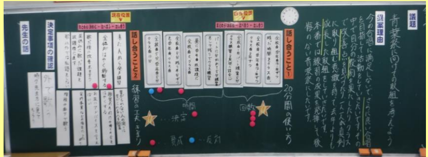
話し合いの進行を可視化