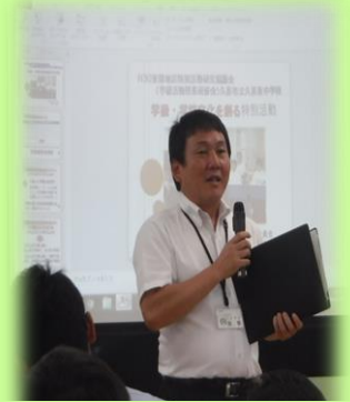
特別活動リーフレット、指導資料を活用した指導