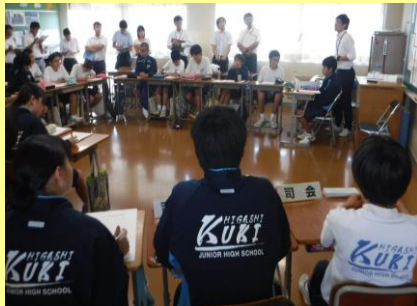
教師と生徒が一体となった話し合い