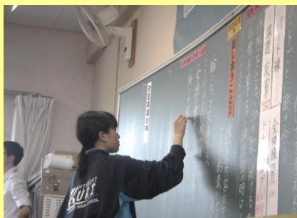
学級活動委員による進行