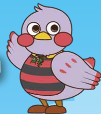
埼玉県のマスコット「さいたまっちゃん」