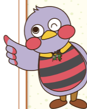
埼玉県マスコット「さいたまっちゃん」