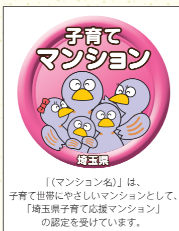
広告への認定マークの掲載イメージ