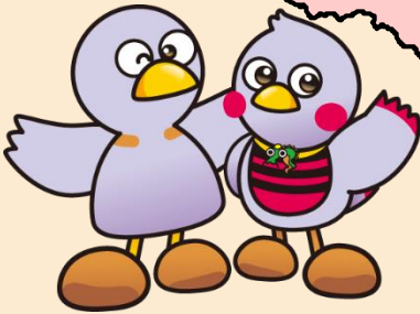
埼玉県マスコット 「コバトン」 「さいたまっち」