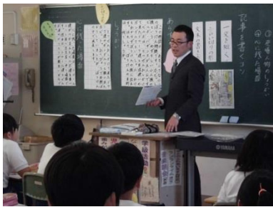
〈国語の授業研究会〉