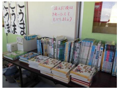
〈教室の並行読書コーナー〉