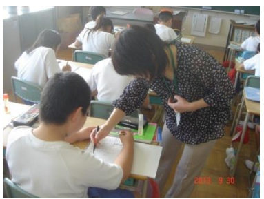
〈習熟度別学習の個別指導〉