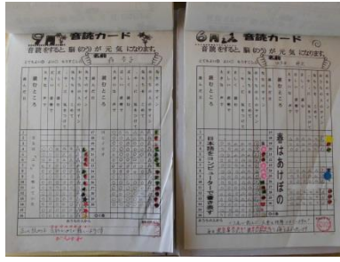
〈児童の音読カード〉