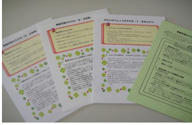
〈家庭学習のてびき〉