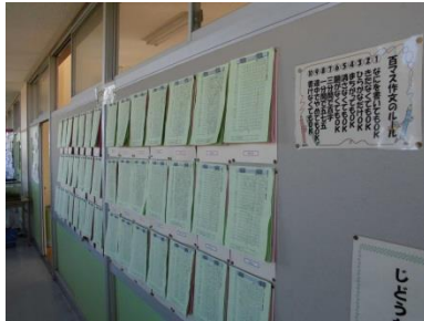
〈百マス作文の掲示〉