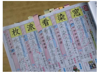
〈付箋を使用した漢字スキル〉