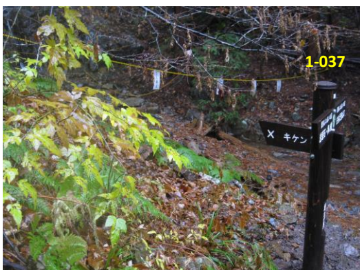
「天狗の滝」から「藤懸の滝」へ下山時