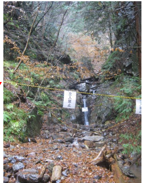
枝沢を正面から撮影