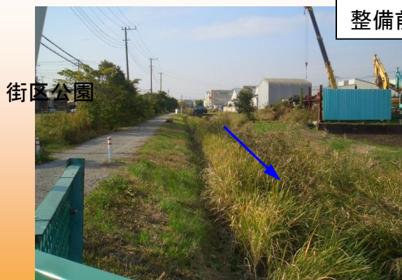
階段がなく川に近づけない(H20.11撮影)