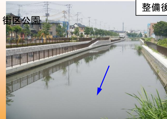
遊歩道等を整備し、川と一体となった憩いの空間を創出(H24.7撮影)