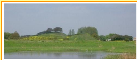
さきたま古墳公園

さきたま古墳公園を水面越しに一望できる旧忍川のビューポイントにデッキを整備し、快適に歴史を感じる風景を実感できるようにしました。