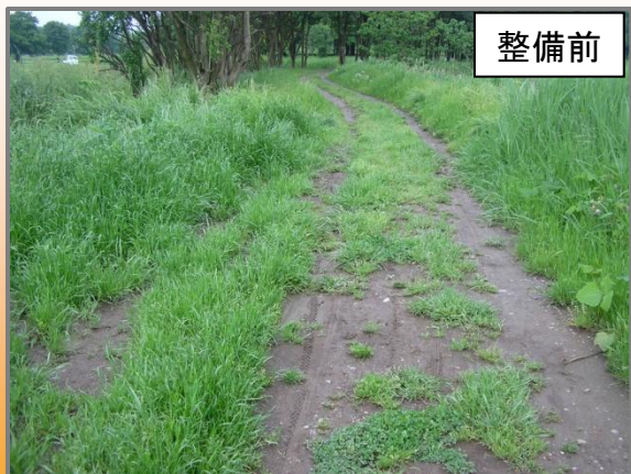
散策路が整備されていない(H16.1撮影)