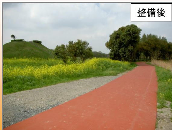
さきたま古墳公園に続く遊歩道を整備(H23.7撮影)