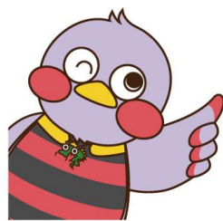
埼玉県マスコット 「さいたまっち」

問い合わせ先 埼玉県教育局市町村支援部人権教育課 〒360-9301 埼玉県さいたま市浦和区高砂 3-15-1 TEL 048-830-6892 E-mail a6890-03@pref.saitama.lg.jp