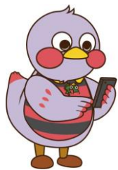
埼玉県マスコット 「さいたまっち」