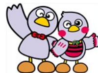
埼玉県マスコット