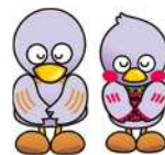
埼玉県マスコット 「コパトン」「さいたまっち」