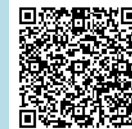
医療情報ネット（ナビイ）

※ 診療時間等は変更されている場合もありますので、受診の際は、念のため各医療機関等にお問い合わせのうえ、お出かけください。