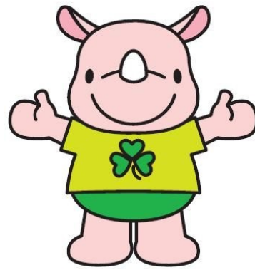
彩の国コミュニティ協議会マスコット 「サイコミ君」

私たちは彩の国コミュニティ協議会の企業会員として、県内のコミュニティ活動を支援しています。（35社）