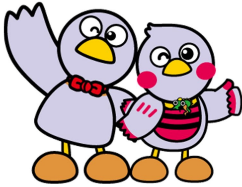
埼玉県マスコット 「コバトン」と「さいたまっち」