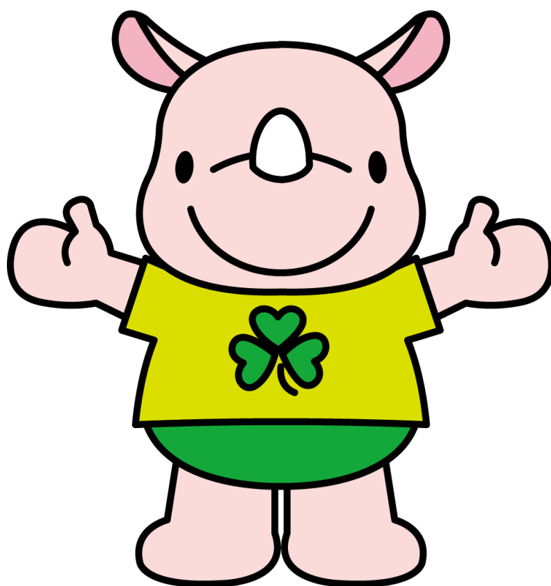
彩の国コミュニティ協議会 マスコット「サイコミ君」

日 時 令和8年6月11日（木） 14時00分 会 場 さいたま商工会議所会館 第1・2ホール