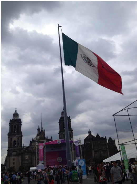
メキシコシティの中央広場“Zocalo（ソカロ）”