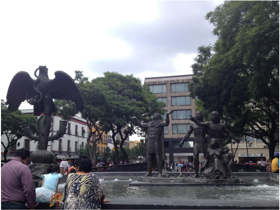
「サボテンの上で蛇をくわえた鷲」のモニュメント