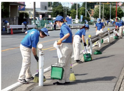
【清掃美化活動の状況】