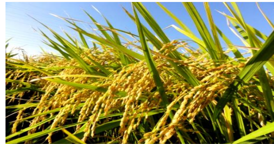
麦あとの水稲栽培「彩のきずな(写真)」 (飼料用米作付面積 大里管内県内1位)