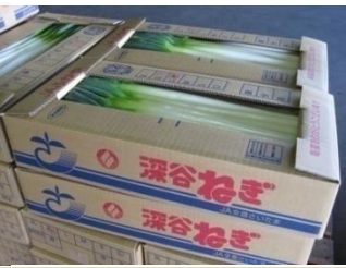
埼玉のブランド野菜の代名詞とも言える「ねぎ」 (作付面積 全国1位:深谷市、4位:熊谷市)