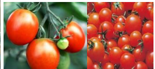
「トマト」 (作付面積 県内1位:深谷市)