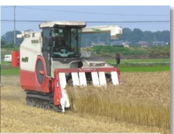
県内一、本州トップクラスの「小麦」産地 (収穫量 本州1位:熊谷市、県内2位:深谷市)