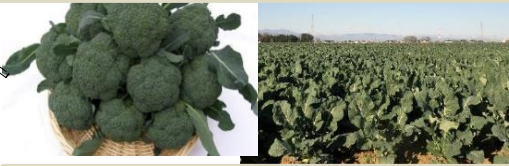
全国に誇る「ブロッコリー」産地 (作付面積 全国1位:深谷市)