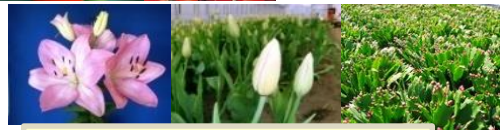
深谷市は全国に誇る花産地 花き類栽培面積 県内1位:深谷市