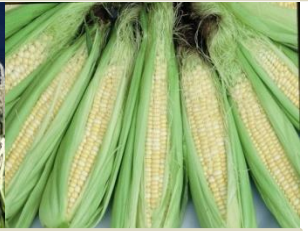
収穫は早朝、深谷市榛沢地区の「スイートコーン」