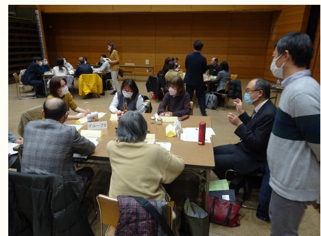
情報交換会(異業種マッチング)

6次産業化担当の普及指導員によるサポート体制に加え、課題の解決や経営改善を目指す農林漁業者等の皆様に、専門家を派遣する制度もあります。