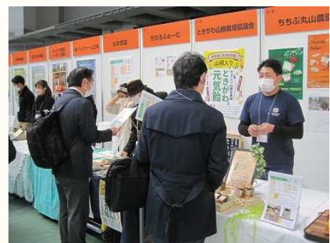
「農業発!新商品お披露目会」で商品紹介