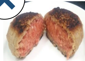
中が赤い生焼けのハンバーグ