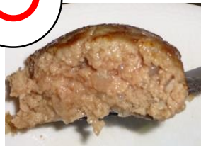
中までしっかり焼けたハンバーグ