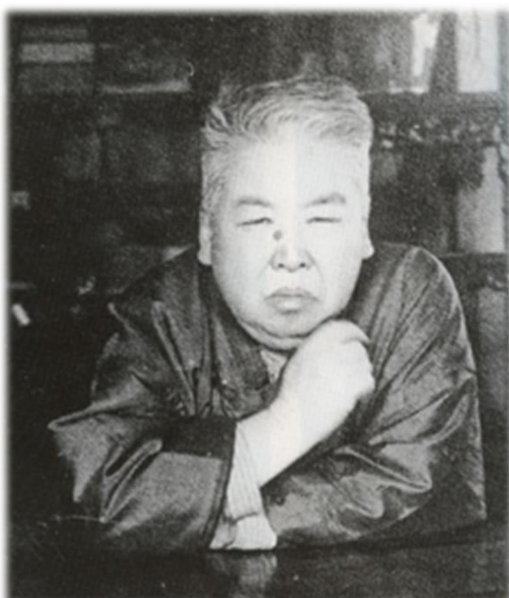
奥原晴湖（おくはらせいこ）