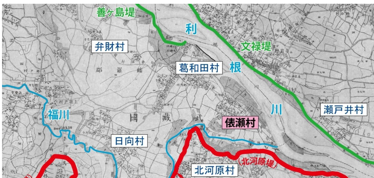
明治当時の周辺地