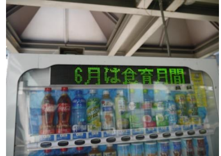
②自動販売機での発信