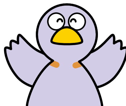
Mascote “Cobaton” da Província de Saitama

Solicitamos a colaboração de todos os cidadãos da Província.