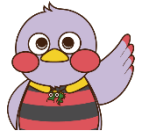
埼玉県のマスコット「さいたまっちゃん」