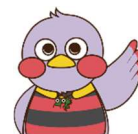
埼玉県のマスコット「さいたまっち」