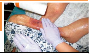
<予防ケア例：保湿ケア>