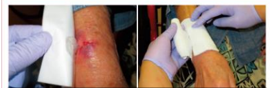
<スキンテア処置方法例>

【日本創傷・オストミー・失禁管理学会 ベストプラクティス作成経緯】(2015) 医療従事者や介護者にスキンテアの認識が乏しく、また指針もなかった為、その予防や発生時の対応に難渋していた。スキンテアは強い疼痛を伴い患者と家族のウェルビーイングを脅かし、また療養者や家族が医療従事者や介護者の不適切なケアが発生の原因と不信を抱く恐れがあった。超高齢社会に伴いスキンテア発症リスクは確実に高まっており、医療者や国民にスキンテアを周知し、療養者及び家族が予防や治療に専念できる環境を提供する必要があった。