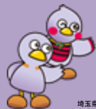
埼玉県のマスコット コバトン&さいたまっちゃん