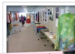
活動発表コーナー