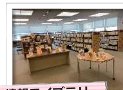
情報ライブラリー