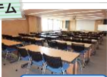
視聴覚セミナー室

視聴覚セミナー室には、 難聴者用補聴システムを 導入しています。 (床下にループを敷設 しています)