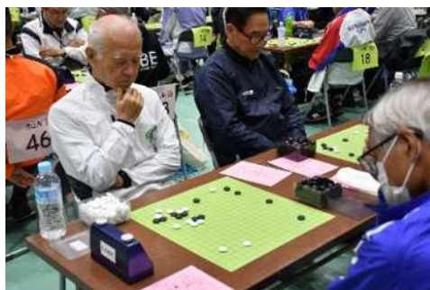
文化交流大会 (囲碁)