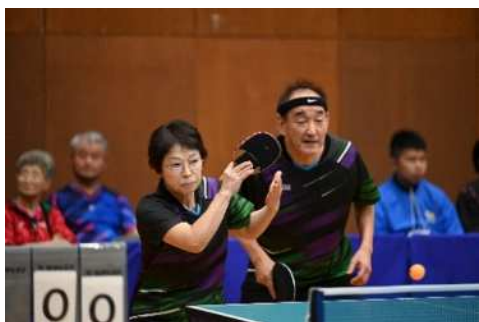
スポーツ交流大会 (卓球)