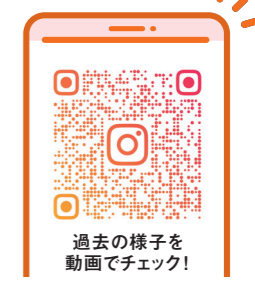
過去の様子を 動画でチェック!

「英語に自信がない」「ほんとうにできるかな…」 大丈夫!先輩たちも、最初はみんな同じでした。