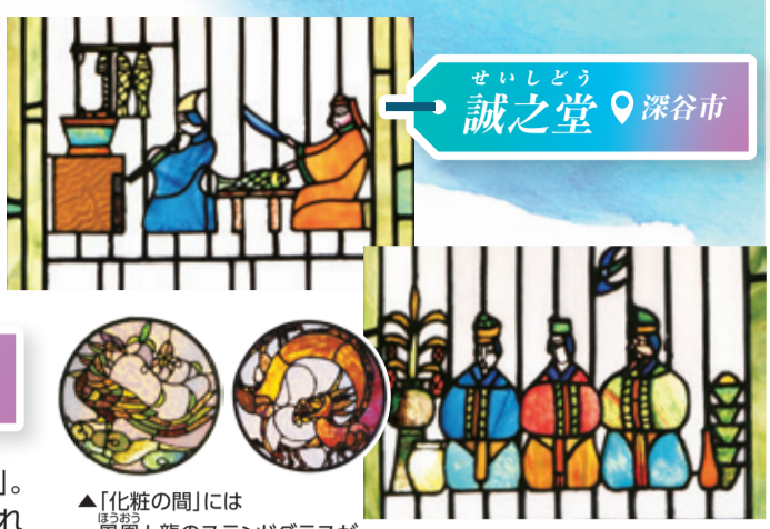
せいしどう 誠之堂 深谷市

県内には、虹のように彩り豊かなスポットが数多くあります。この夏は、歴史や文化、季節の行事が織り成す「色」を楽しんでみませんか。