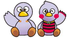
埼玉県マスコット コバトン&さいたまっち

そこで、商店街の様々な課題の解決に取り組む事業者の皆様や商店街を側面から支援する市町村・商工団体職員を対象とし、商店街の活性化に向けて後押しをしていくため、課題に応じた全4回のセミナー・ワークショップを実施します。