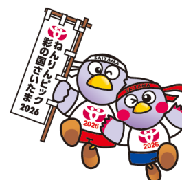
コバトン&さいたまっち