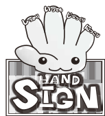
道路横断時の安全行動イメージキャラクター「サイン(SIGN)ちゃん」