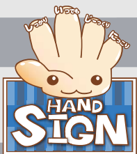
道路横断時の安全行動イメージキャラクター 「サイン (SIGN) ちゃん」