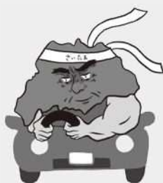
歩行者優先イメージキャラクター「さいたまお父さん」