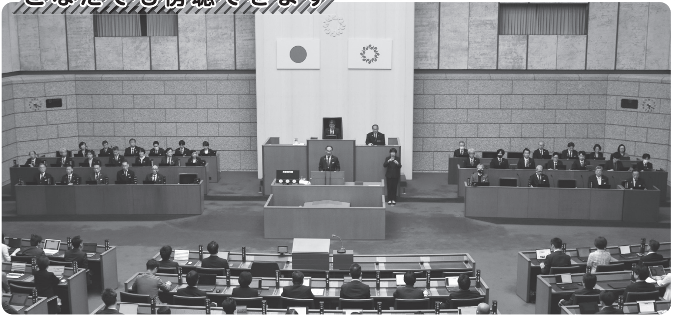
本会議場（令和8年2月定例会）

県議会の本会議は、県議会議事堂4階の傍聴者受付で手続きをしていただければ傍聴ができます。本会議の傍聴席は216席です。傍聴席とは別室で、乳幼児・児童のお子様と一緒に気兼ねなく傍聴できる専用スペースもご用意しています。