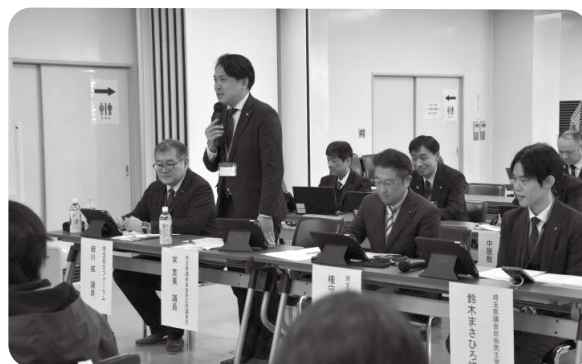
議員との意見交換