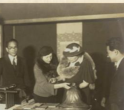
▲保己一の小さな像に親しげに触れているヘレン・ケラー