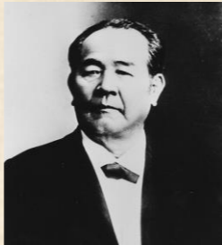
▲渋沢栄一