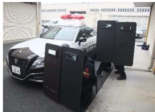
先着勤務員の現場離脱状況