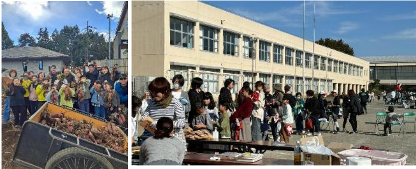
試食会 子供たちとの交流