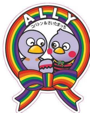
ステッカーデザイン