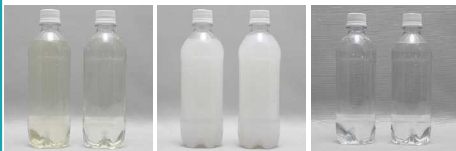
清涼飲料水 洗濯用合成洗剤 清涼飲料水 洗濯用合成洗剤