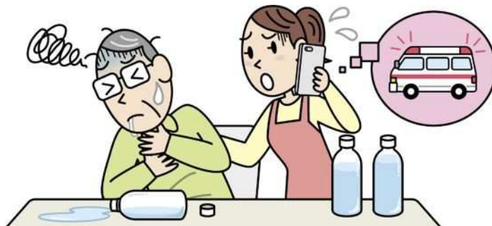
イラスト：川崎 敏郎

飲料用ペットボトルの中身がはっきり分からないときは、絶対に口にはしてはいけません。もし誤って飲んでしまったら、何らかの症状がある場合、また、子どもや高齢者の場合は誤嚥のリスクが高く重篤化しやすいため症状の有無にかかわらず必ず医療機関を受診しましょう。子どもや高齢者は嚥下機能が弱く、気付かないうちに飲んだものが気道へ入り込むことがあります。受診の際は、移し替えた物質が分かる情報（ラベル、製品名、写真など）を持参してください。容器を持ち運ぶ場合は、破損に十分注意してください。症状がない場合でも、医療機関または#7119 (注11) 、公益財団法人日本中毒情報センター (注12) に相談しましょう。