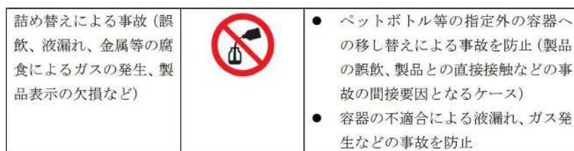
図 「家庭用消費者製品における製品安全表示図記号の使用・適用等に関する自主基準 附属書2 予見される事故に関連する安全図記号及びその防止効果」日本石鹼洗剤工業会 制定年月日：平成28年12月16日