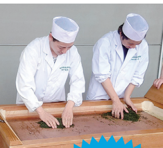
お茶の淹れ方教室